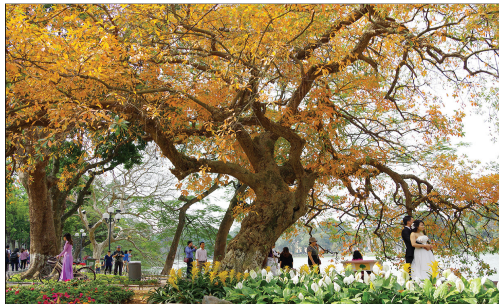
Mùa cây thay lá hấp dẫn khách du lịch cũng như tất cả mọi người.