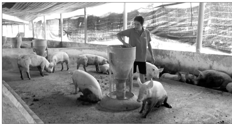
Người dân Đồng Nai đang nỗ lực thực hiện phòng bệnh cho heo.

Tuyến metro số 1 là dự án đặc biệt quan trọng không chỉ với thành phố mà còn cả nước, là biểu tượng của mối quan hệ Việt Nam - Nhật Bản. Vì thế, việc dự án này được đẩy mạnh triển khai ngay từ đầu năm nay là tín hiệu đáng mừng để dự án có thể đảm bảo đưa vào vận hành vào cuối năm 2020. ■