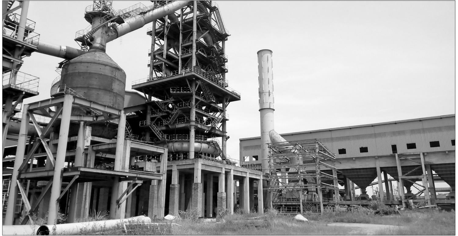
Dù đã được "hà hơi, tiếp sức" nhưng dự án mở rộng sản xuất giai đoạn 2 của Tisco vẫn bất động.

Giao kết là vậy, song trong quá trình thực hiện hợp đồng, Tisco và MCC đã ký 10 phụ lục điều chỉnh nhiều nội dung quan trọng của hợp đồng EPC. Ngày 15/5/2013, Chủ tịch HĐQT Tisco ký quyết định phê duyệt điều chỉnh tổng