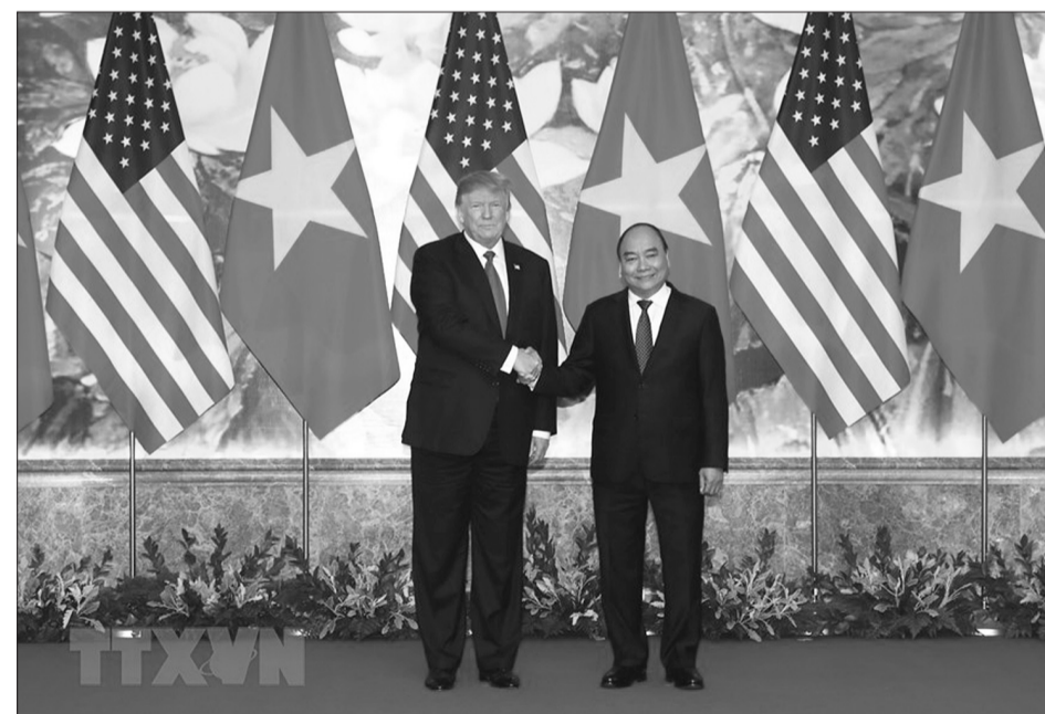
Thủ tướng Nguyễn Xuân Phúc chào mừng Tổng thống Donald Trump thăm Việt Nam.

Để duy trì và thúc đẩy đà phát triển tốt đẹp của quan hệ kinh tế - thương mại, hai bên nhất trí cần tiếp tục triển khai các cơ chế hợp tác hiện có như Hiệp định Thương mại Việt Nam - Hoa