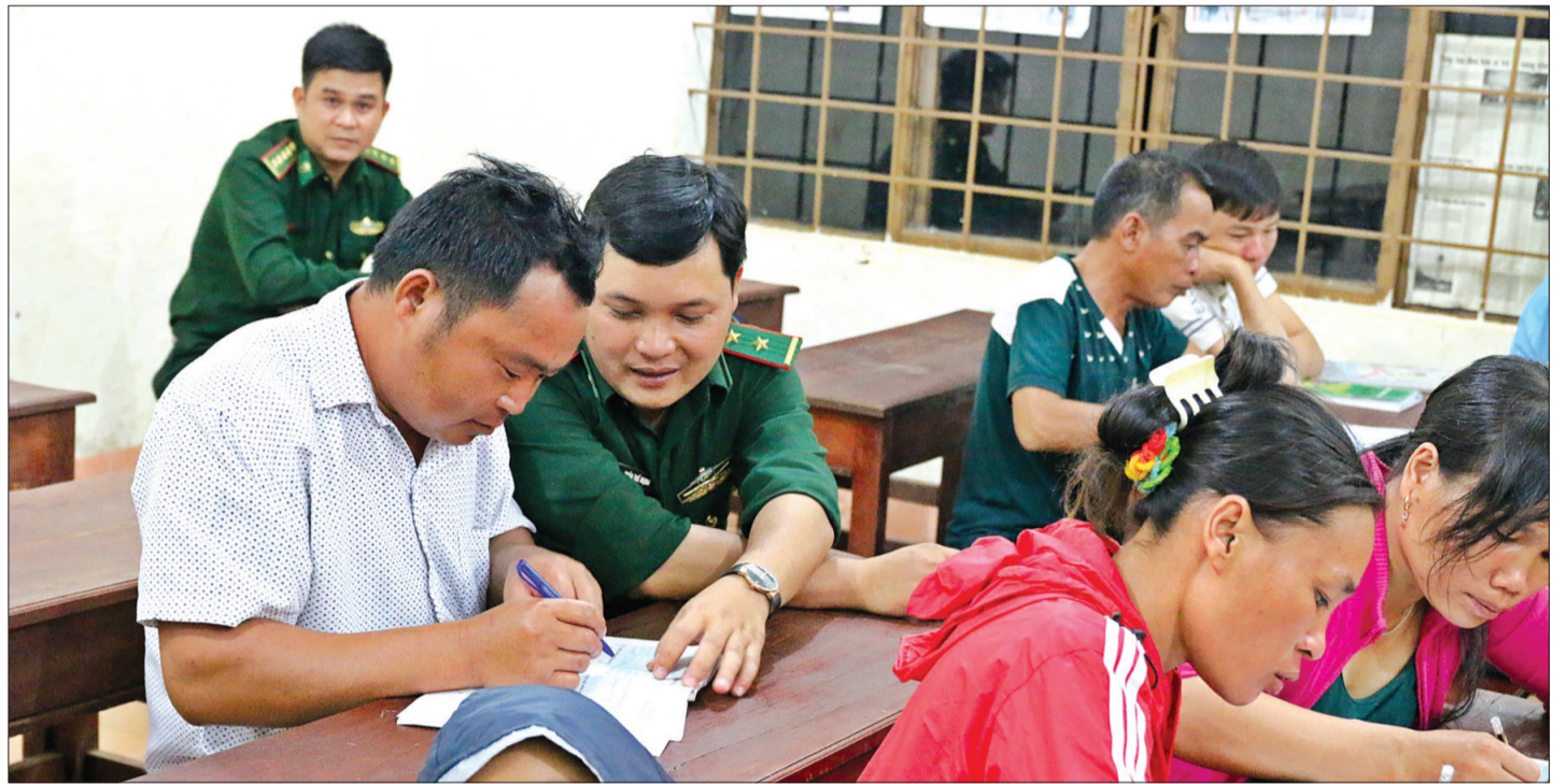
BĐBP Đồn Biên phòng Ea'Hleo tổ chức lớp xóa mù chữ cho phụ nữ nghèo tại xã Ie Rve, Ea Súp, Đắk Lắk.

Chính bởi có những người dân như ông Sầm Văn Ri-ông hay ông Đàm Văn Chải, mà đến nay, toàn bộ hệ thống đường biên, mốc quốc giới ở Cao Bằng được gần 5.700 hộ dân ký cam kết tự quản, bà con yên tâm sinh sống, sản xuất trên tuyến biên giới. Điều ý nghĩa nhất là người dân coi bảo vệ đường biên, cột mốc không chỉ là trách nhiệm, mà còn là niềm tự hào của họ. Việc tự quản đường biên, cột mốc được tiến hành ngay trên thực địa từng xóm, bản. Đối với những gia đình cư trú sát đường biên giới, họ còn tự giác tự quản trên chính các khu vực đất đai thuộc gia đình mình. Mỗi dịp 3/3 hằng năm, Ngày biên phòng toàn dân trở thành ngày hội của cả bản, cả xã, huyện.