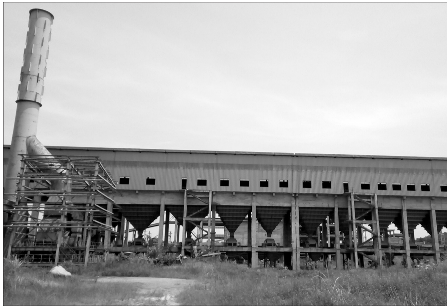
Theo ông Phạm Chí Cường: Công nghệ sản xuất của Gang thép Thái Nguyên không lạc hậu.

Tôi đã từng theo dõi những tồn đọng của Tisco giai đoạn 2, ảnh hưởng đến hoạt động của Tổng công ty Thép và toàn ngành thép. Với kinh nghiệm nửa thế kỷ gắn bó với ngành thép, tôi thấy rằng hiện trạng của Tisco không đến mức như nhiều cơ quan báo chí đề cập, rằng công nghệ lạc hậu, máy móc đẽ hàng chục năm phơi nắng phơi mưa nên chỉ còn là đồng sắt vụn... Đó chỉ là đứng ở ngoài nhìn vào thôi. Nếu như những người quản lý, những người đang lãnh đạo trực tiếp và các cơ quan quản lý lắng nghe ý kiến của CBCNV trong ngành thép và đặc biệt của Tisco, và quyết tâm xử lý thì không đến nỗi là không có lối thoát. Tisco giai đoạn 1 với công suất hiện tại 500.000 - 600.000 tấn thép/năm vẫn sản xuất có lãi và đang nuôi số lượng công nhân gần 5.000 người. Tại sao chỉ vì đầu tư giai đoạn 2 dở dang lại để cho nó khó khăn như vậy, và có nguy cơ nếu không sớm có giải pháp giải quyết thì sẽ phá sản cả khu gang thép và không biết rằng các vấn đề xã hội có thể phát sinh như thế nào? Tất nhiên, để giải quyết vấn đề hiện tại của Tisco có những khó khăn nhất định, nhưng theo tôi thì vẫn có phương án giải quyết để có thể thoái được vốn nhà nước, thu hút đầu tư và đảm bảo an sinh xã hội cho toàn khu gang thép.