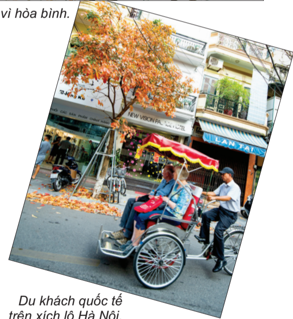
Du khách quốc tế trên xích lô Hà Nội.