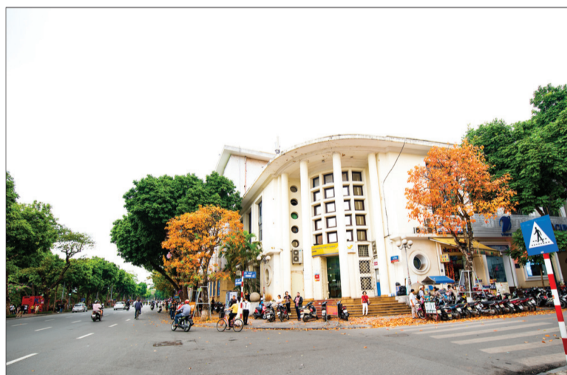
Góc phố Đinh Lễ - Đinh Tiên Hoàng dịu dàng đến lạ.