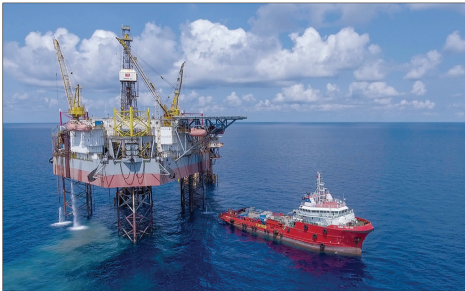
PVN tiếp tục đẩy mạnh thực hiện kế hoạch tìm kiếm, bảo đảm gia tăng trữ lượng dầu khí năm 2019.