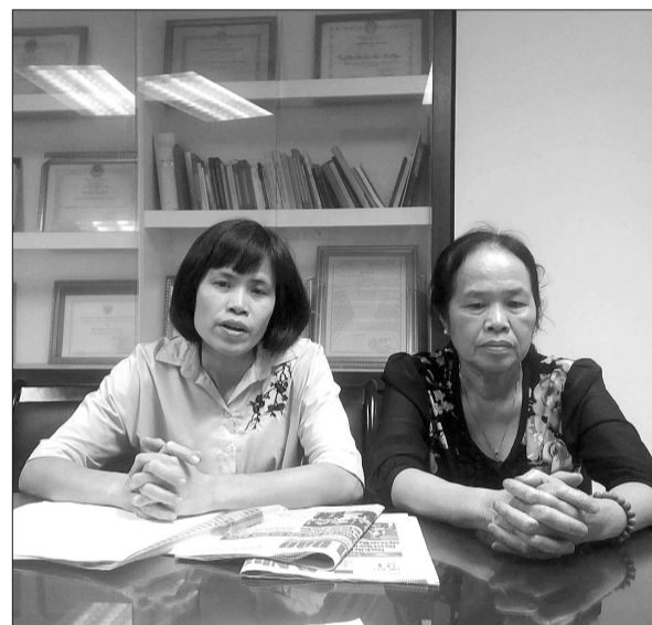
Hai mẹ con chị Yên đến làm việc tại tòa soạn.

Tháng 12/2017, Chủ tịch UBND quận Thanh Xuân đã ra Kết luận số 2011/KL-CTUBND và chỉ đạo: UBND phường Thanh Xuân Trung phối hợp với Thanh tra xây dựng quận lập