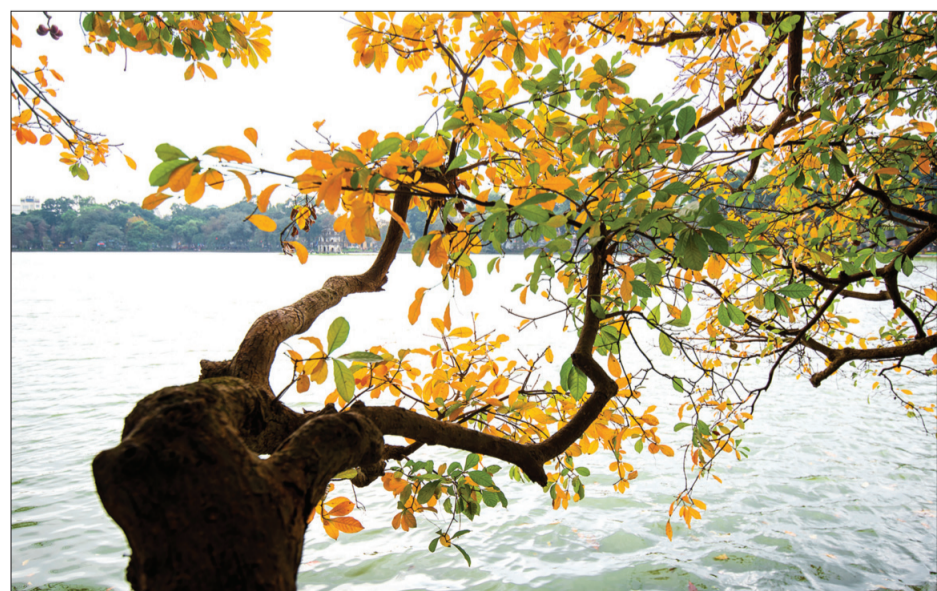
Vẻ đẹp mê hồn của cây lộc vừng mùa thay lá.