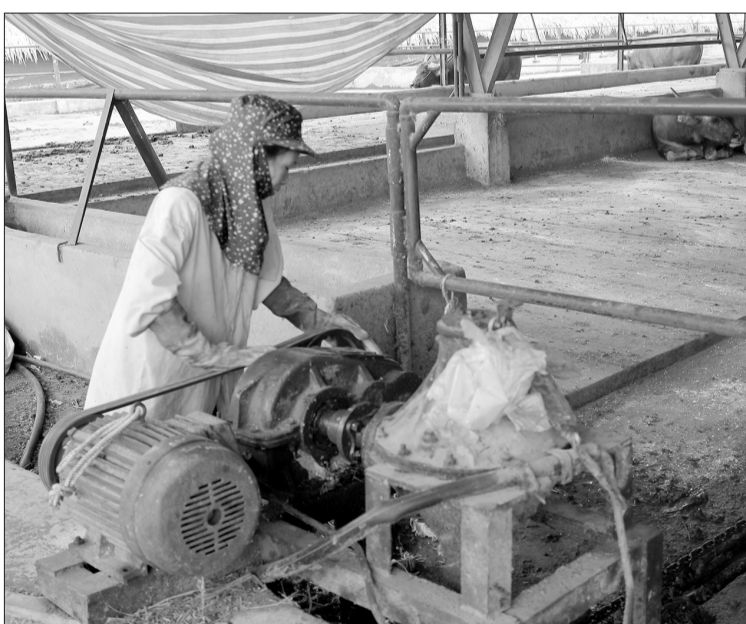
Công nhân dọn phân bằng máy móc.