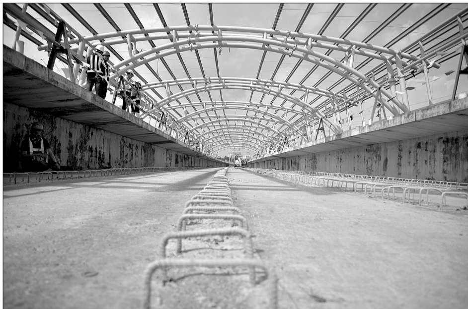
Metro số 1 - ga Phước Long.