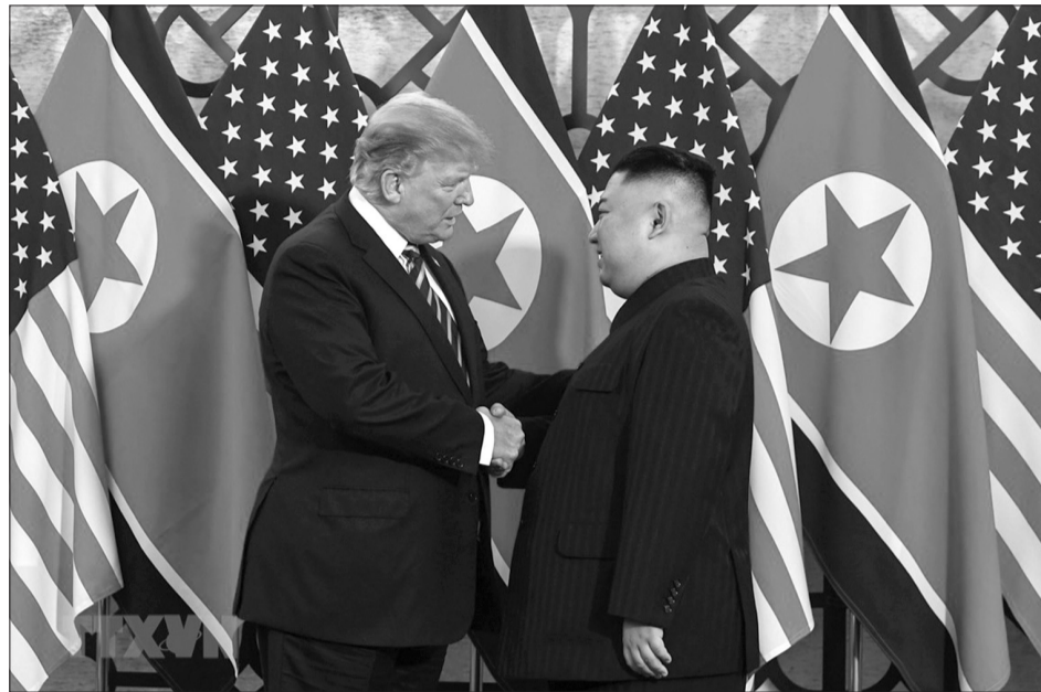
Tổng thống Donald Trump và Chủ tịch Kim Jong-un đã có cái bắt tay lịch sử tại Hà Nội.

Trước khi gặp ông Kim Jong-un vào tối ngày 27/2 tại khách sạn Metropole ở thủ đô Hà Nội, ông Trump đã có những cuộc hội kiến với Tổng Bí thư, Chủ tịch nước Nguyễn Phú Trọng và Thủ tướng Chính phủ Nguyễn Xuân Phúc. Những phát biểu của chủ và khách, những đánh giá và biểu hiện cảm nhận cũng như những chủ đề nội dung được trao đổi giữa Tổng Bí thư, Chủ tịch nước Nguyễn Phú Trọng và Thủ tướng Chính phủ Nguyễn Xuân Phúc với ông Trump đều thể hiện có sự đồng thuận quan điểm sâu rộng về thực