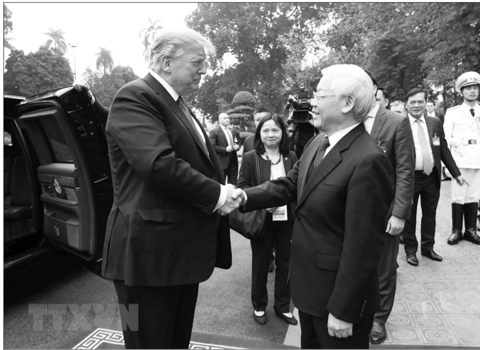
Tổng thống Donald Trump đã có cuộc hội đàm với Tổng Bí thư, Chủ tịch nước Nguyễn Phú Trọng.

Tổng Bí thư, Chủ tịch nước Nguyễn Phú Trọng bày tỏ vui mừng trước sự phát triển tích cực và toàn diện của quan hệ Việt Nam - Hoa Kỳ thời gian