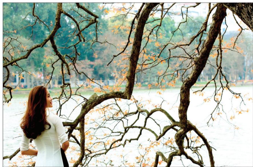
Nét duyên Hà Nội, thành phố vì hòa bình.

Bờ Hồ, Hàng Bông, Hàng Đậu và rất nhiều con phố khác đều khoác lên mình chiếc áo mới của mùa xuân. Nhiều người còn cho rằng, cứ trông thật nhiều lộc vừng thì sẽ đến lúc Hà Nội có một mùa lá đỏ, lá vàng trở thành “đặc sản” ấn tượng không kém nước bạn ấy chứ! ■