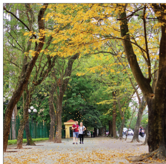
Check-in ở Hà Nội mà ngỡ ở nước nào.