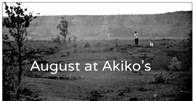
August at Akiko's

mà ta nghĩ là ta biết, nhưng thực ra biết quá ít - Hawaii.