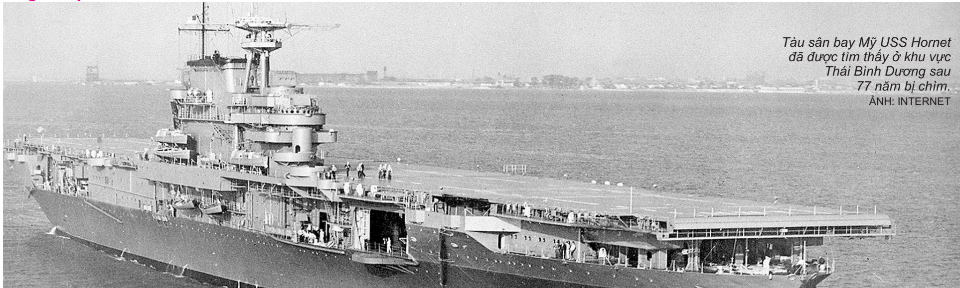
Tàu sân bay Mỹ USS Hornet đã được tìm thấy ở khu vực Thái Bình Dương sau 77 năm bị chìm.