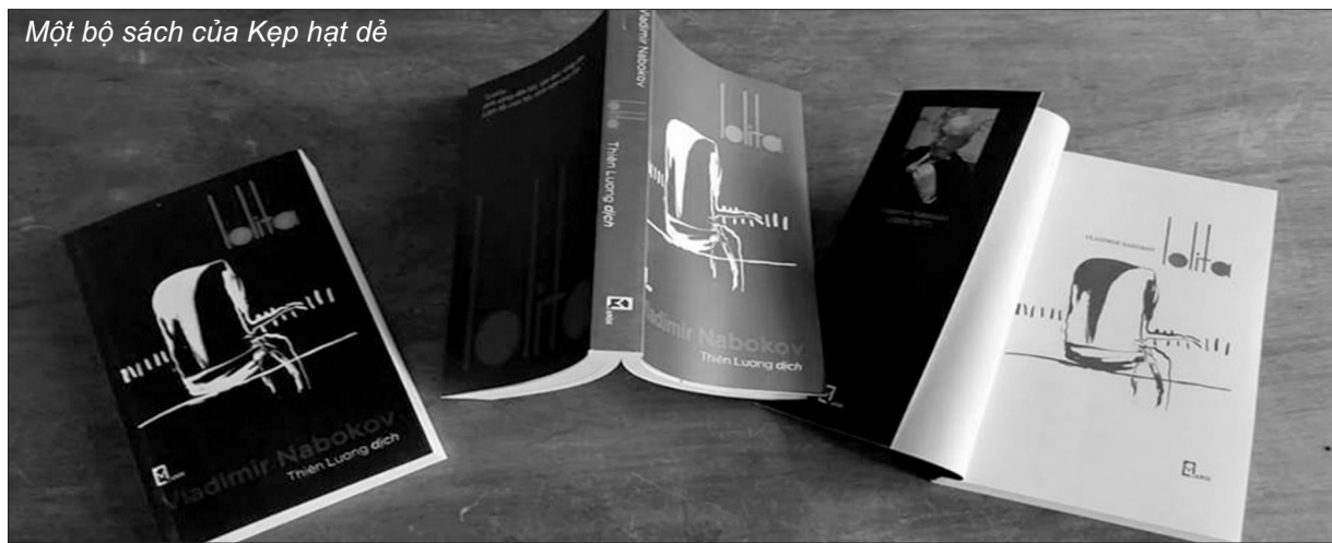
Một bộ sách của Kẹp hạt dẻ