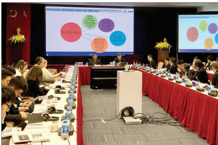
Toàn cảnh buổi Hội thảo.

Trong bối cảnh hệ thống điện đang chịu nhiều áp lực về bảo đảm cung ứng điện, thì việc phát triển các dự án năng lượng mặt trời, trong đó có điện mặt trời áp mái được xem là một trong những giải pháp góp phần giảm áp lực cho ngành điện. Để gỡ vướng