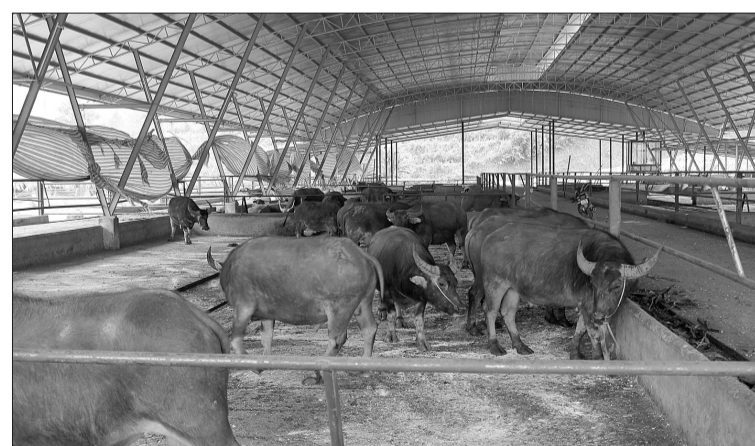
Đàn trâu trong trang trại.

được tiêm phòng đầy đủ và chăm sóc theo một chế độ khoa học; thức ăn từ tinh đến thô đều được đảm bảo vệ sinh tuyệt đối... Chính vì vậy, sản phẩm chăn nuôi từ Bình Nguyên Xanh được khách hàng rất ưa chuộng. Những con trâu, bò nặng từ 300-700kg giá hơi có thời điểm lên tới 80.000 đồng/kg, không chỉ phục vụ nội địa mà còn xuất ra nước ngoài.