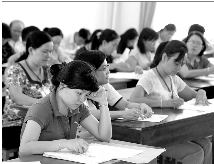
Thay đổi quy chế thi THPT Quốc gia cho phù hợp để tránh xảy ra tiêu cực.

Sở GD-ĐT địa phương chịu trách nhiệm chuẩn bị hệ thống máy