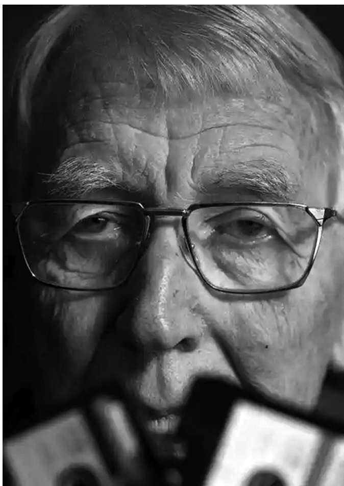
Kỹ sư âm thanh Lou Ottens.