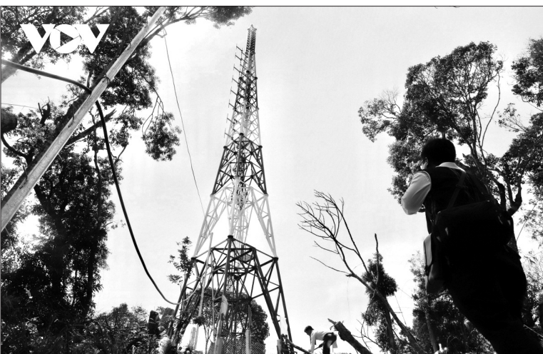
Với lợi thế độ cao 1369m, trạm phát sóng FM tự động tại đỉnh núi Quế với công suất 5kW có thể phủ sóng tốt chương trình VOV1 và chương trình tiếng dân tộc Cơ Tu.