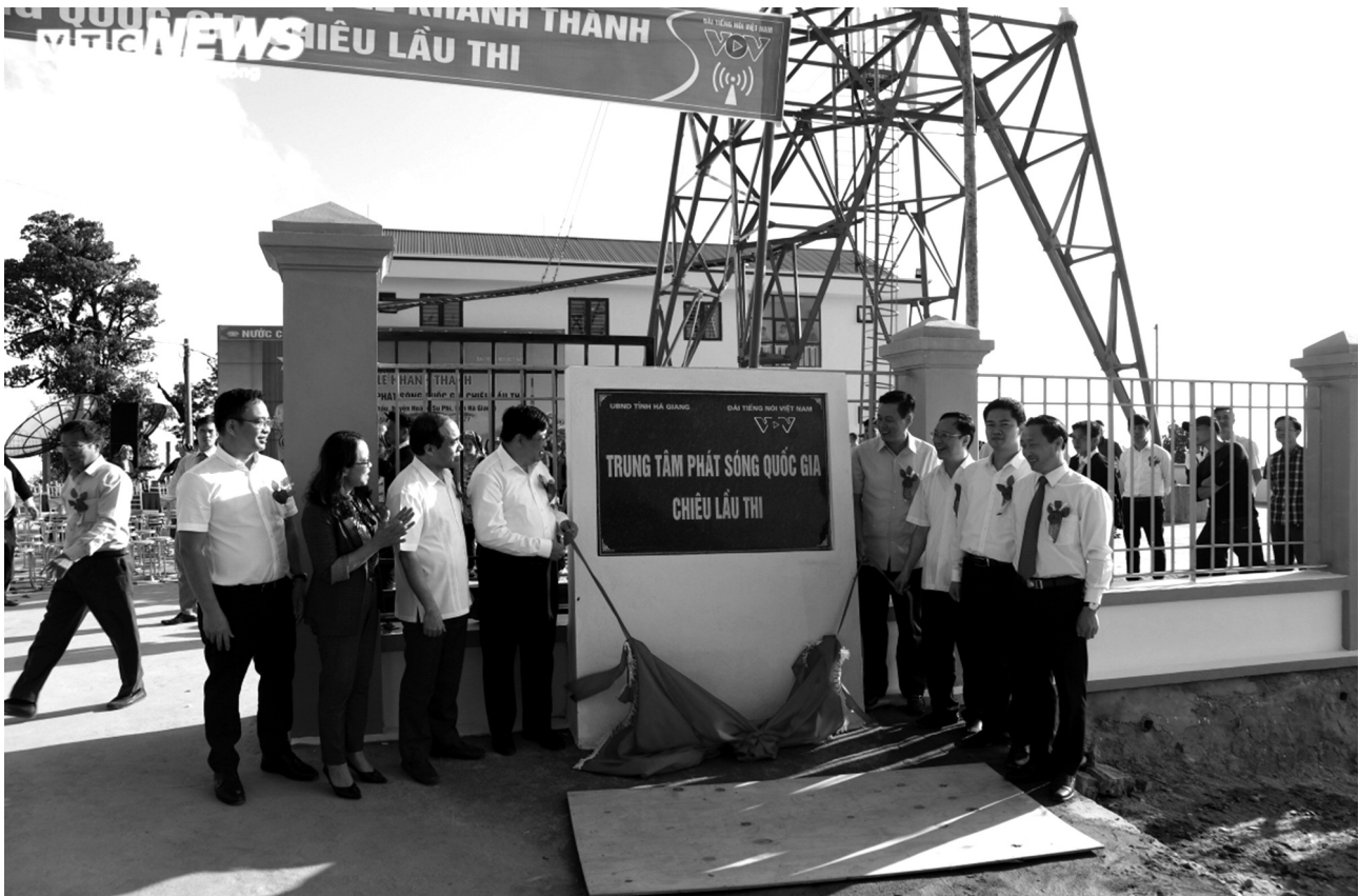
Các đại biểu cắt băng khánh thành Trung tâm Phát sóng Quốc gia Chiều Lâu Thi.

Trung tâm phát sóng đi vào hoạt động sẽ giúp làn sóng của Đài Tiếng nói Việt Nam tới trên 2,1 triệu đồng bào các dân tộc ở tỉnh Hà Giang và một phần tỉnh Tuyên Quang, Lào Cai, Yên Bái, Phú Thọ.