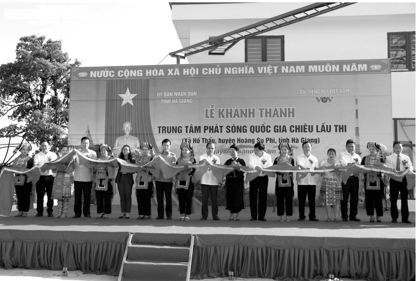
Lãnh đạo các bộ, ngành Trung ương, lãnh đạo VOV và tỉnh Hà Giang cắt băng khánh thành Trung tâm phát sóng. (ẢNH: VTCNEWS)