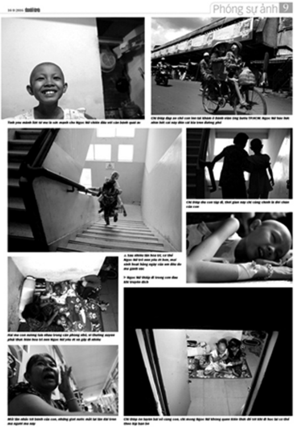
8 Phóng sự ảnh 9 1. Hình ảnh con trai mắc bệnh ung thư của người mẹ bán xôi ở quê hương quê hương con trai mắc bệnh ung thư... (Caption continues with details of the photos)

8 Phóng sự ảnh Người mẹ bán xôi và đứa con nuôi ung thư Người mẹ bán xôi ở quê hương quê hương con trai mắc bệnh ung thư... (Text continues with details of the mother's struggle and the child's illness) VIỆT NAM