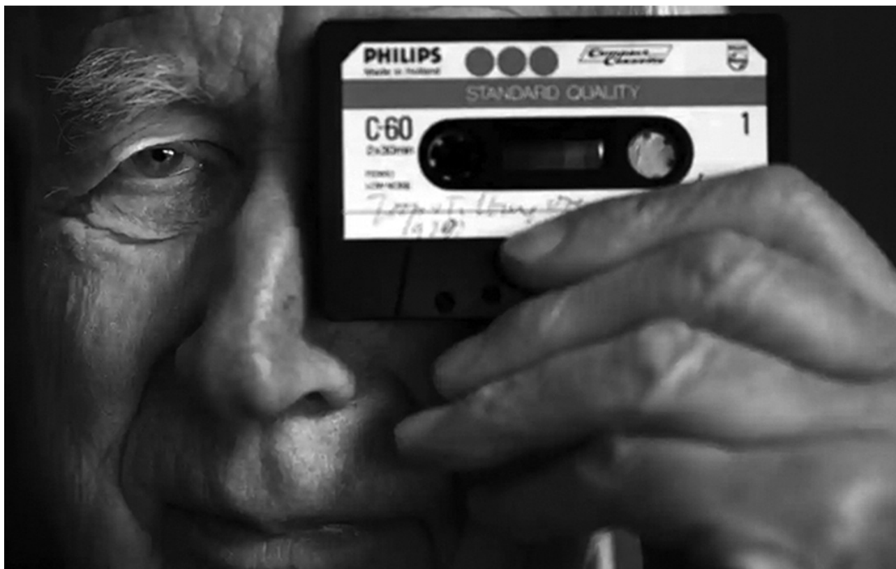
Lou Ottens lần đầu giới thiệu băng cassette với công chúng năm 1963.

phát triển chiếc một thiết bị nghe nhạc bỏ túi. Năm 1963, đội ngũ của ông giới thiệu chiếc băng cassette đầu tiên tại một hội chợ điện tử ở Berlin, Đức. “Nhỏ hơn một bao thuốc lá”, Ottens giới thiệu thiết bị tại sự kiện.