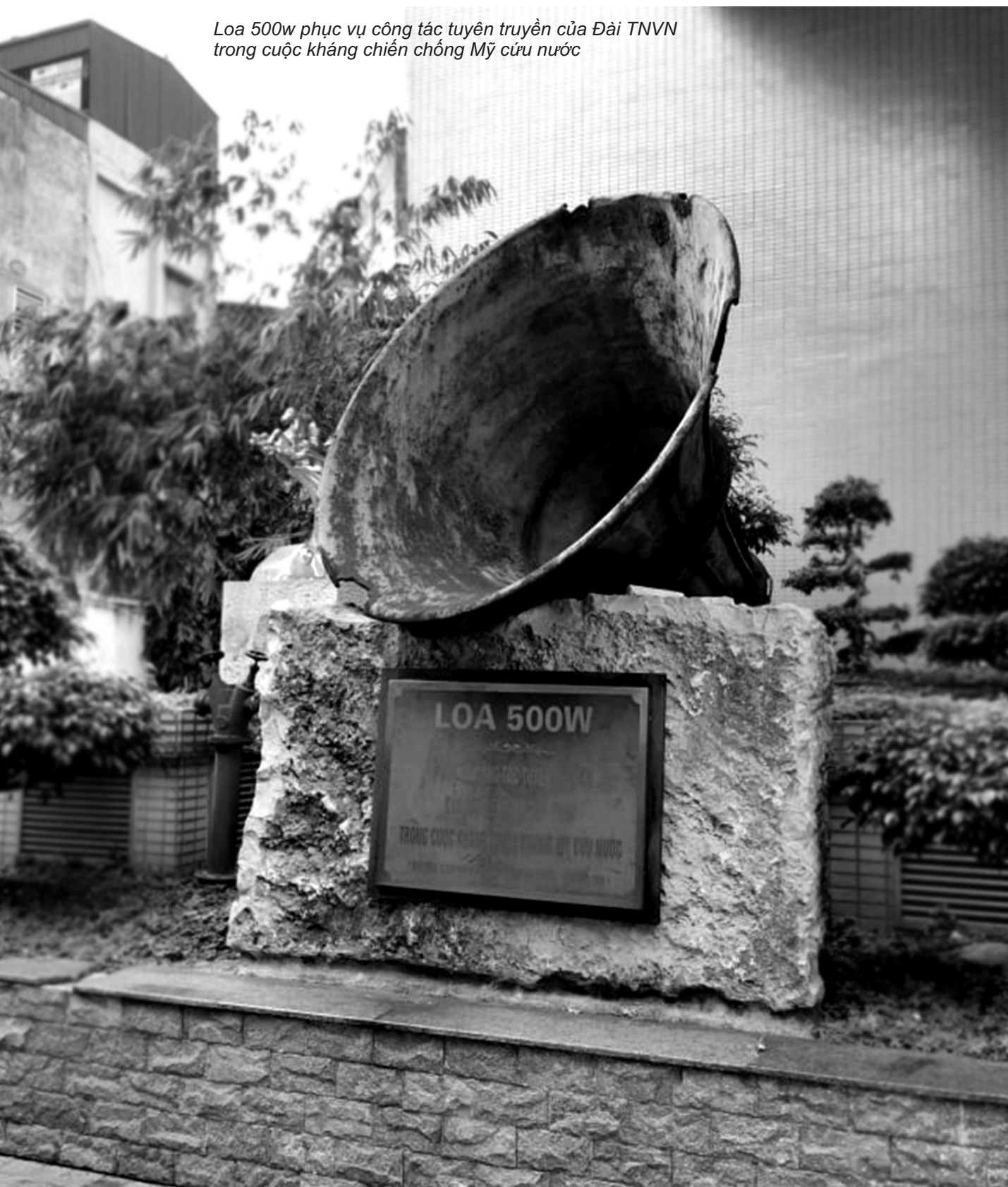
Loa 500w phục vụ công tác tuyên truyền của Đài TNVN trong cuộc kháng chiến chống Mỹ cứu nước