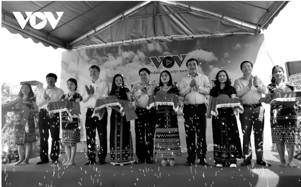
Nghi lễ cắt băng Khánh thành trạm phát sóng FM tự động tại đỉnh Quế, tỉnh Quảng Nam.